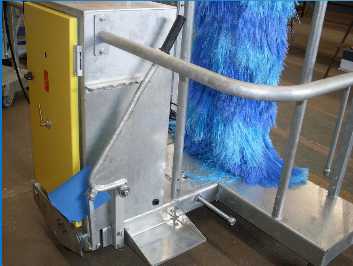
Detalhe de la base