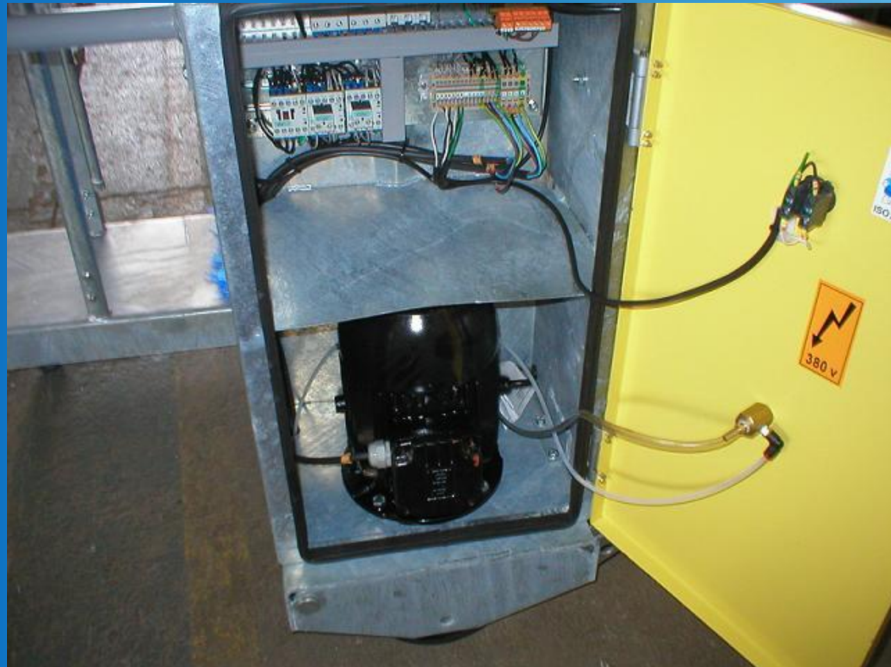
Motor eléctrico 2CV – 8 polos