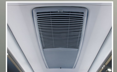
Rejilla de aire acondicionado integrada al techo