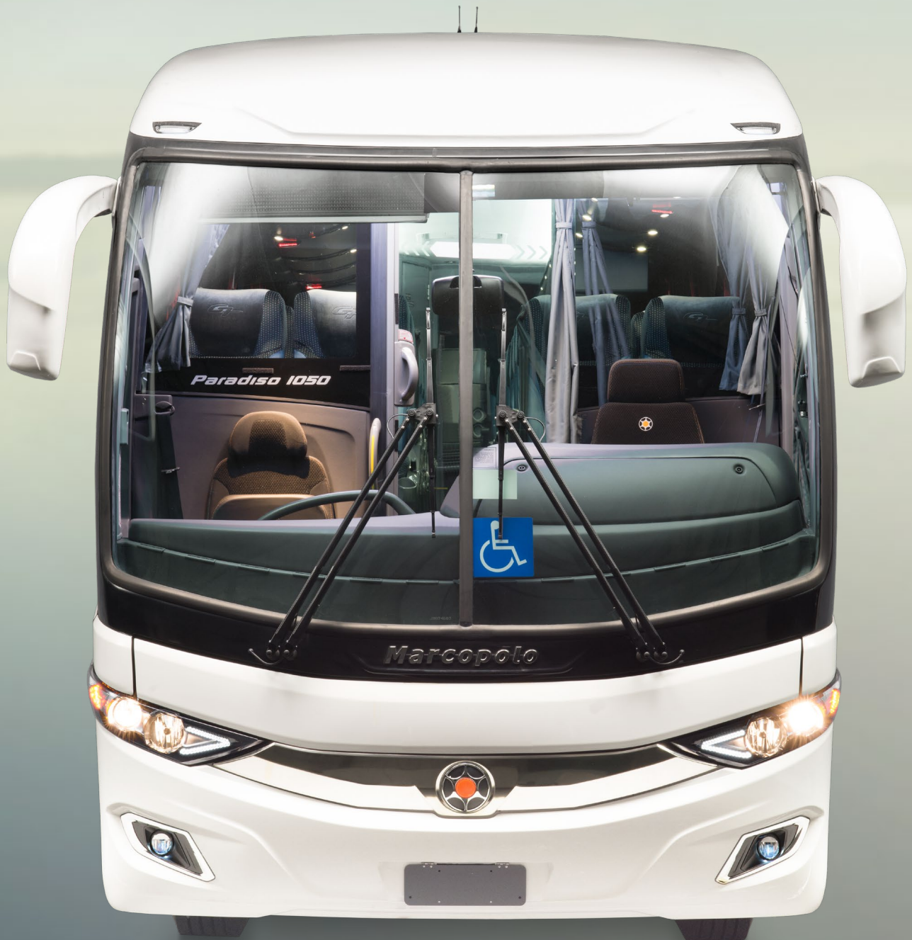
Paradiso New G7 1050