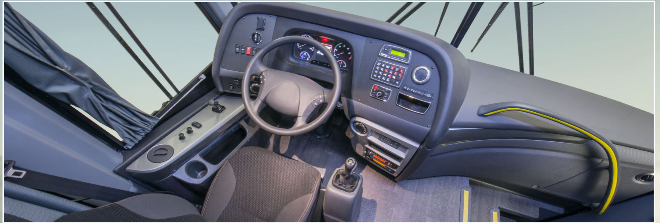
Cabina del conductor: nuevo panel y decoración interna

La Línea Paradiso New G7 llega trayendo alteraciones externas e internas que elevan el nivel de sofisticación, confort, seguridad y eficiencia transformando los modelos ya reconocidos por el mercado. El Paradiso New G7 1050 presenta versatilidad para atender las necesidades y superar las expectativas de pasajeros, conductores y dueños de flotas de líneas de transporte de personas y turismo en cortas y medias distancias.