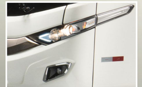
Conjunto óptico: faroles con nuevo diseño interno y DRL integrado.

Butaca Ejecutiva: nuevas opciones de tejidos y acabados